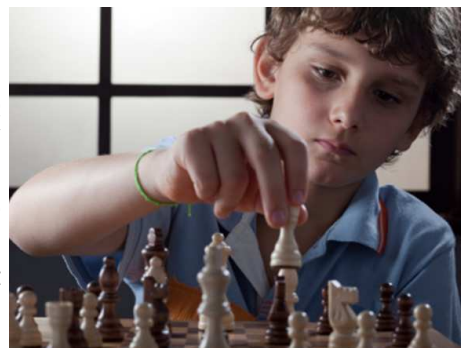
Význam COGMED tréninku pro nadané děti

Neuropsychologické vyšetření ukázalo, že i když tento mladý muž měl IQ vysoko nad průměrem, jeho pracovní paměť byla v rozmezí normálních hodnot pro dítě jeho věku. Jeho rodiče si mysleli, že by mohlo být přínosem, pokud jeho pracovní paměť může být zvýšena, trénovat pomocí COGMED tréninku, aby jeho pracovní paměť byla více v souladu s jeho vyšším skóre IQ. Výsledky: Je vidět výrazné zvýšení pracovní paměti, účastní se a vyhrává státní turnaje v šachu. Rodiče jsou nadšeni, že vidí zvýšení synova potenciálu.