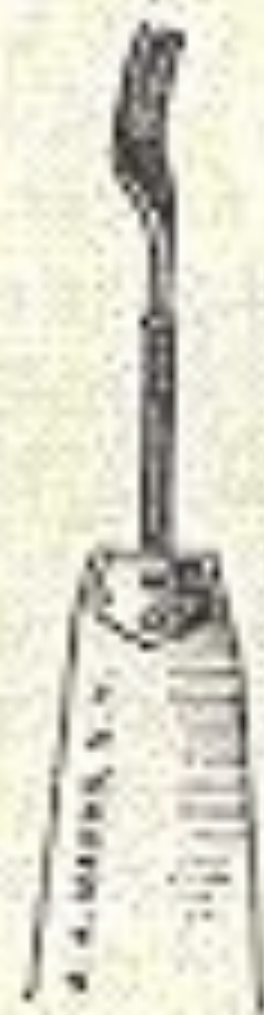
Cut O 5.