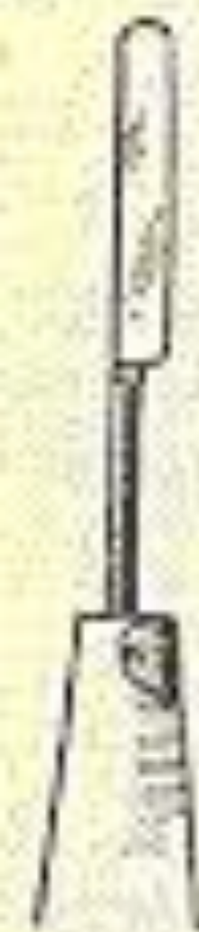
Cut O 4.