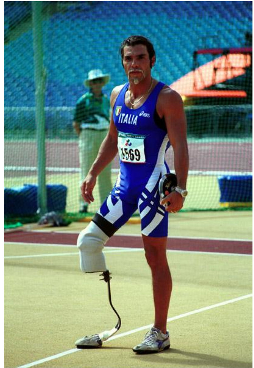
KURIS (ITA) prepares for his discus throw, Sydney Paralympic Games, October 2000