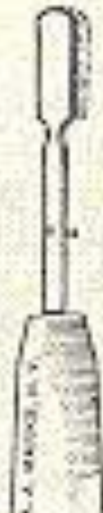
Cut O 7.