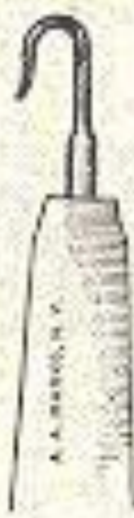
Cut O 6.