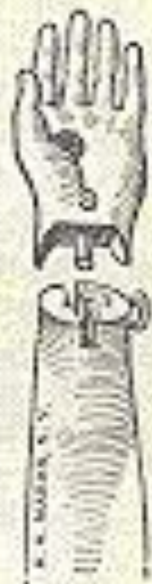
Cut O 8.